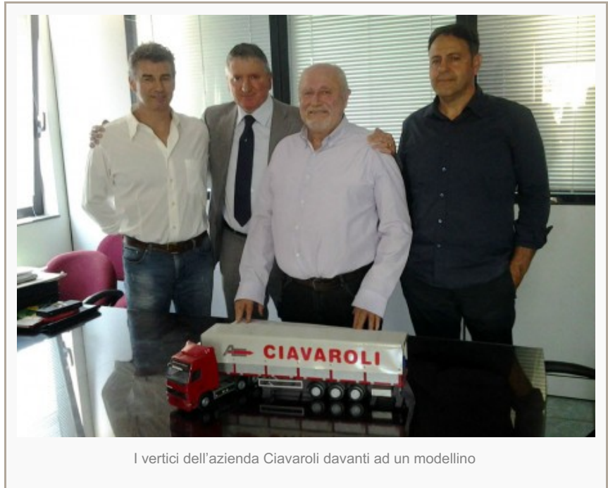
I vertici dell'azienda Ciavaroli davanti ad un modellino