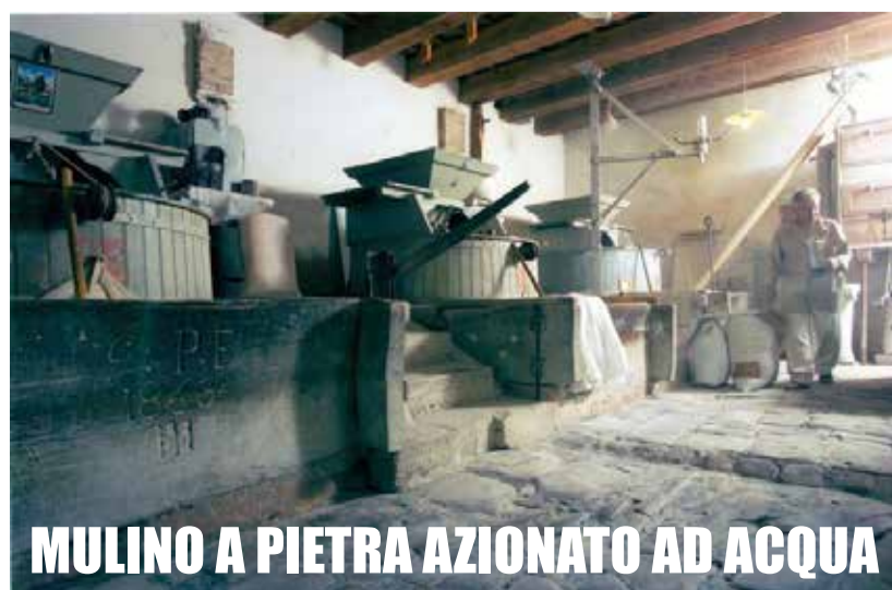
MULINO A PIETRA AZIONATO AD ACQUA

Orari di apertura 9.00 – 13.00 / 14.30 – 19.00 Info: tel. 337.293830